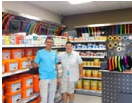
Malerei, Farbenfachgeschäft Trockenbau, Bodenverlegung Zeltingerstr. 8, Tel. 0664 / 28 45 088

Ebenfalls neu seit 25. Juni: Stukkateur- und Trockenbaumeisterbetrieb.